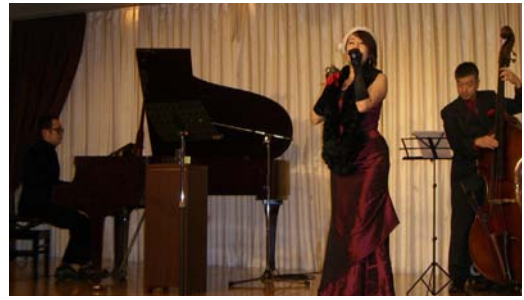
ジャズコンサート