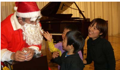
おもちゃのプレゼント