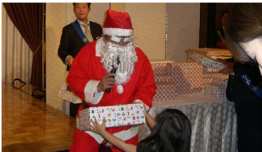
子供達へのプレゼント