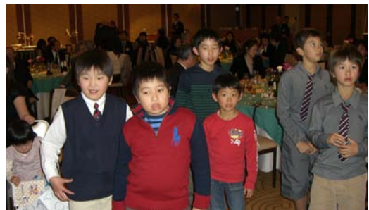
子供達へのプレゼント