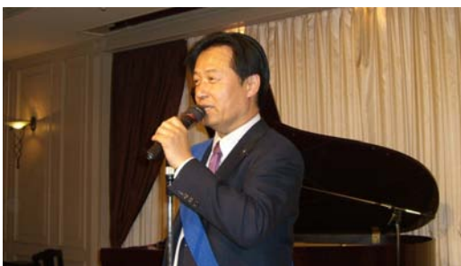
小林親睦活動委員長挨拶