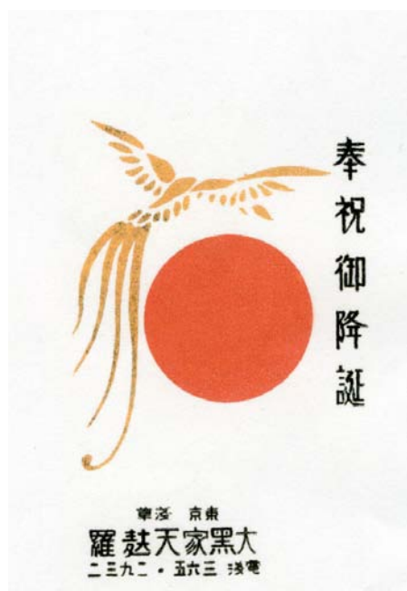
⑥奉祝 御降誕（昭和 8 年）