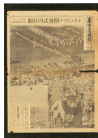
⑤東京日日新聞8月13日 号外