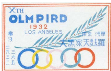
③第 10 回ロサンゼルスオリンピック